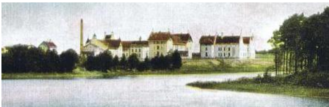
Historische Aufnahme der Heil- und Pflegeanstalt

Die Gesamtfläche des Planungsgebietes beträgt 32 ha. Der Planungsstandort war ursprünglich Heil- und Pflegeanstalt und von 1945-1992 Teil einer militärisch genutzten Liegenschaft. Nach 1992 wurde diese Nutzung aufgegeben. Der Planungsstandort liegt seitdem brach.